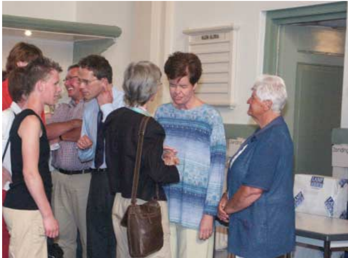
De Protestantse Kerkgemeenschap nam massaal afscheid van de dominee

De Hoek is ook het dorp geweest waar onze kinderen hun jeugd hebben doorgebracht. En dan ben je in de Hoek best goed uit. Strand, duinen, paardrijden, Sinterklaas die tenminste écht op een boot aankomt, knutselstee, avondvierdaagse, veilige omgeving, een drietal goede scholen. Zij behouden alledrie dierbare