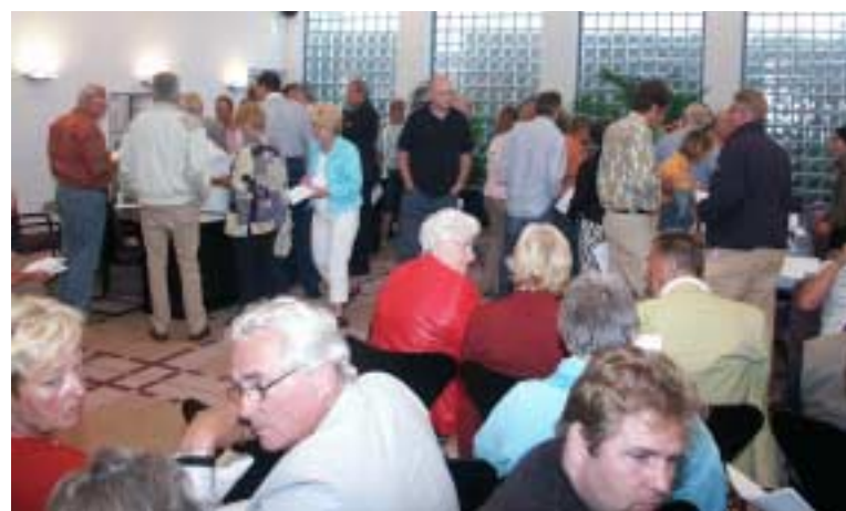
In de raadszaal kon informatie verkregen worden

Op de avond kwamen naar schatting een dikke tweehonderd men-