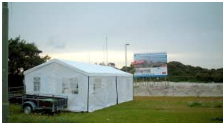
Op de plek waar vroeger De Peppers was, werd in een partytent de sfeer een beetje herschapen

Aardappel" (voor Kees) is met vereende krachten de roemruchte