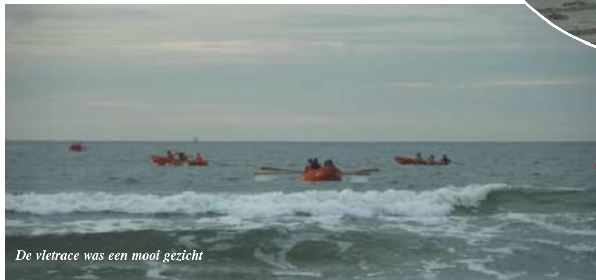
De vletrace was een mooi gezicht

peddelden de deelnemers samen naar het strand.