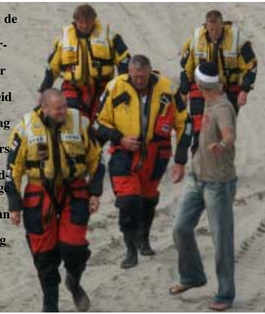
De bemanning van de reddingboten kwamen in vol ornaat aan land

Vaak is het zo dat de redders van de KNRM watersporters het een en ander leren. Zeker als het gaat om zaken op het gebied van veiligheid. Afgelopen zaterdag was het eigenlijk andersom. Redders van de Kapiteins Hazewinkel en redders van de George Dijkstra uit Ter Heijde. Kregen van leden van de Kitesurfvereniging voorlichting.