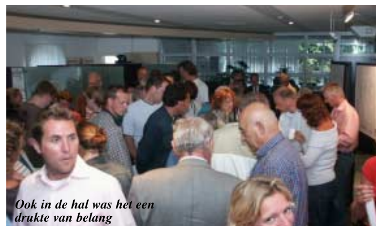
Ook in de hal was het een drukte van belang

Vanaf het recreatieoord werden in de nacht van zondag op maandag twee fietsen gestolen. De rijwielen stonden in een schuurtje van het vakantieverblijf en werden, terwijl de eigenaar sliep gestolen.