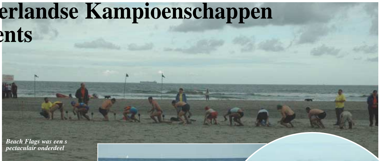
Beach Flags was een spectaculair onderdeel

Na het startsignaal legden de deelnemers een parcours af dat bestond uit 200 meter hardlopen, 300 meter zwemmen en vervol-