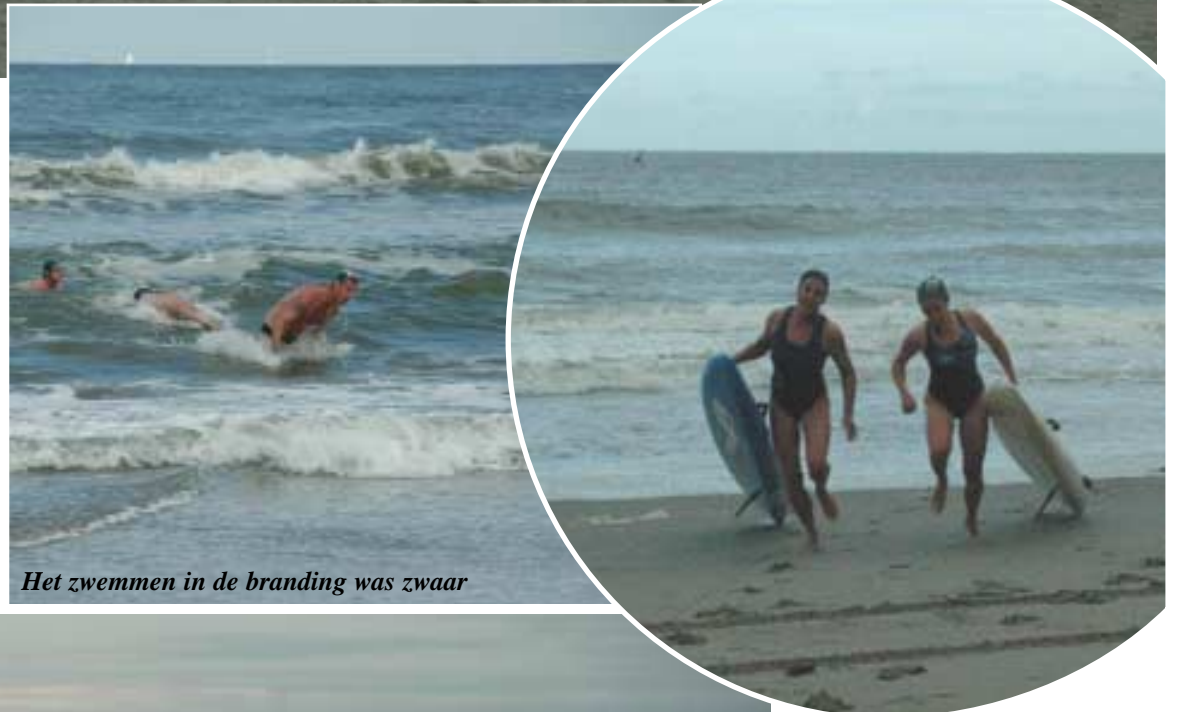
Het zwemmen in de branding was zwaar

Aan de start bevonden zich de ploegen bestaande uit een redder en een drenkeling. Op het startsignaal zwom de drenkeling naar een boei in het water. Zodra de zwemmer bij de boei was aangekomen vertrok de redder met het paddleboard. Als deze bij de boei aankwam, klom de drenkeling voor op het board, hierbij moest de boei worden gerond. Vervolgens